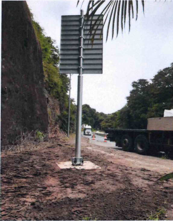
distance mât-BDR, distance mât-glièzière